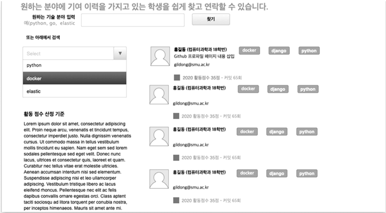
<그림 2. OSS 헤드헌팅 시스템의 화면 가안>